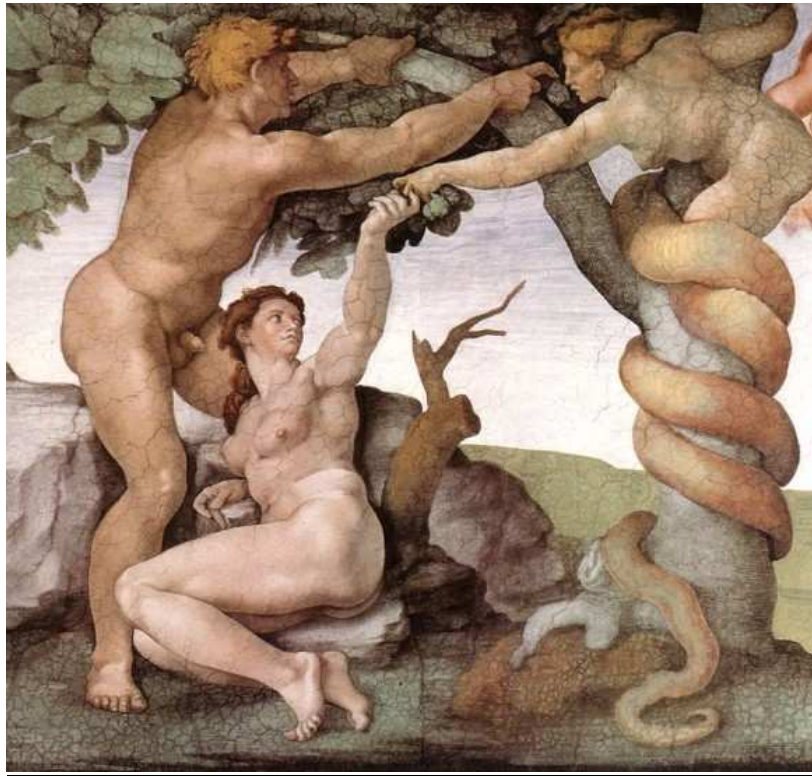
Zo zag Michelangelo de Zondeval in de Sixtijnse Kapel (Vaticaan). Let op de vrouwelijke slang.