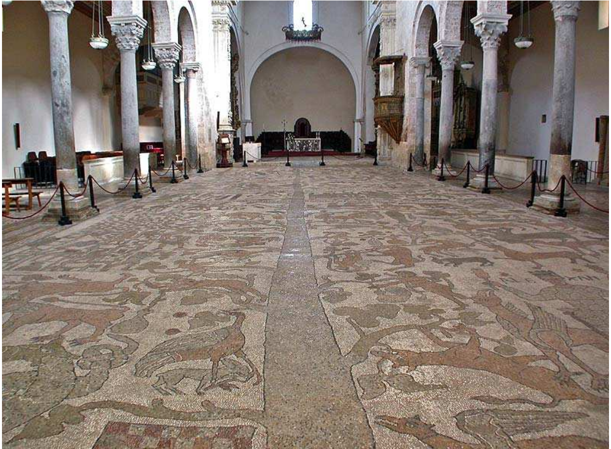
Nogmaals het geheel