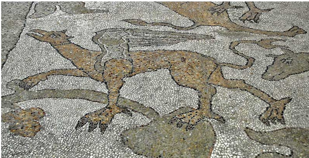
Griffioenen, enkele van de talrijke mythologische dieren.