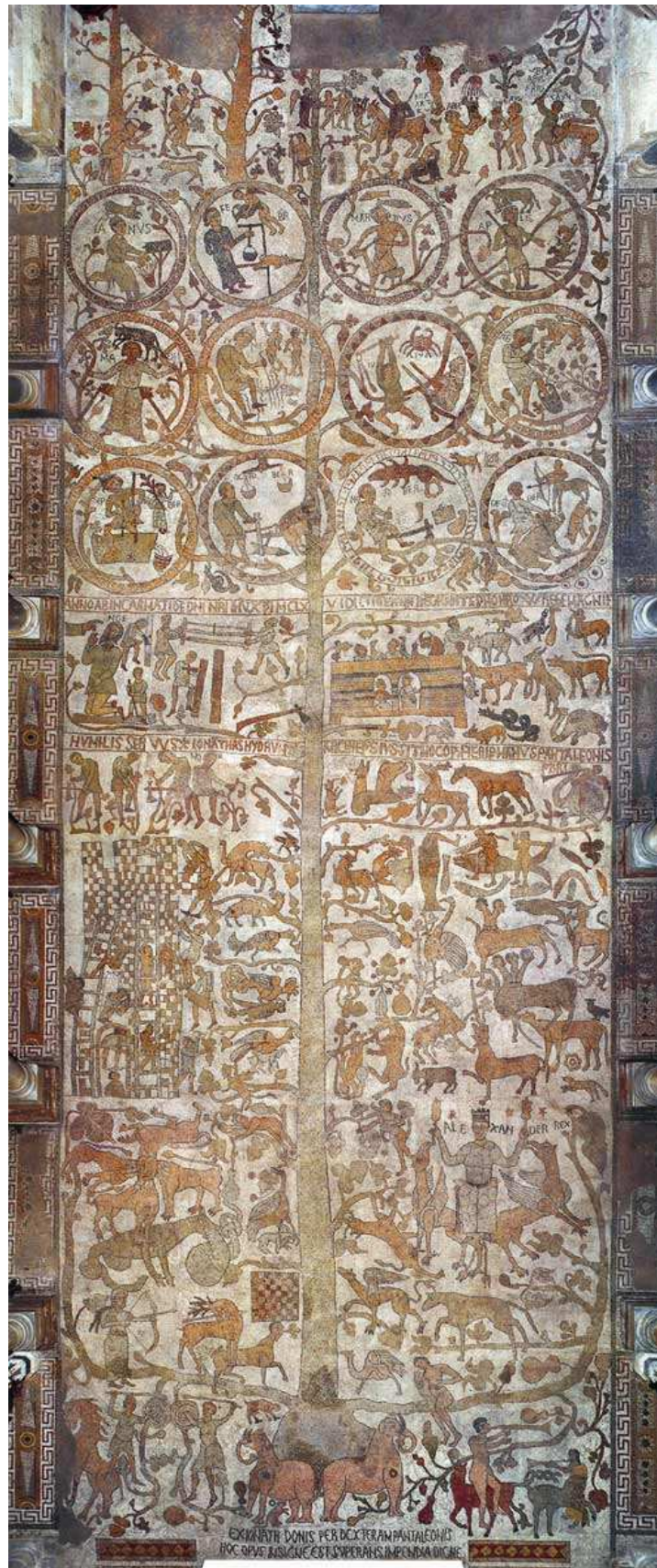
Boven, na de maanden van het jaar met de sterrenbeelden van dierenriem en de werken van elke maand, zie je de zondeval van Adam en Eva, met rechts daarvan Kain (de oudste zoon van Adam) die zijn broer Abel vermoordt. Let rechts, derde register van beneden op de voorstelling van Alexander Rex , Alexander de Grote gezeten op twee gevleugelde mythologische dieren.