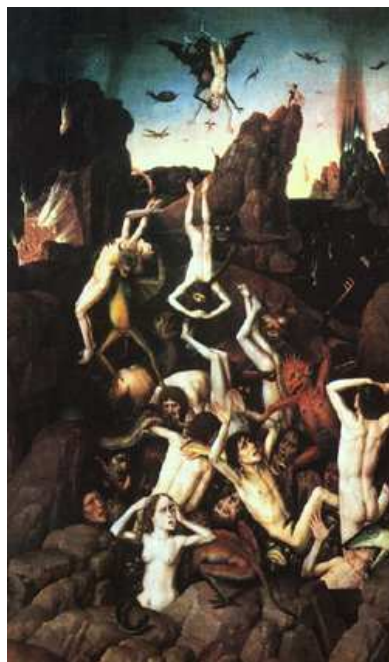
Dirk Bouts, De val der verdoemden . Rechterluik van een triptiek. Zie ook het Laatste Oordeel van Memling in Bijlage 2: Vézelay en het middeleeuwse wereldbeeld , p. 16.