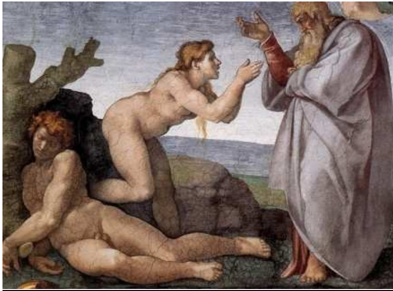
De schepping van Eva (Sixtijnse Kapel)