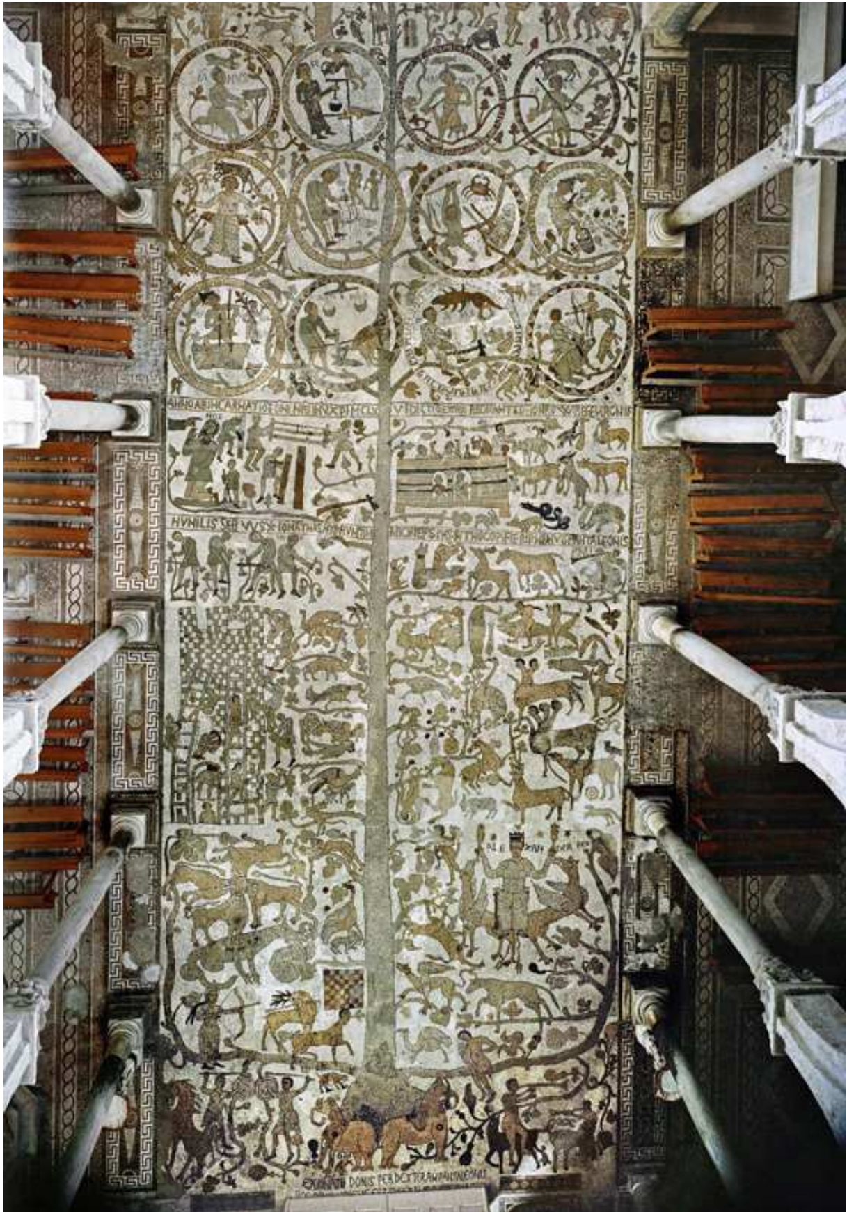
Het vloermozaïek in zijn geheel. De Levensboom steunt op de ruggen van twee olifanten.