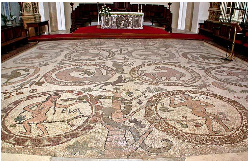
Eva en Adam, voor de zondeval in de Hof van Eden

Vreemd: Alexander de Grote wordt hier negatief voorgesteld, al voorbeeld van hoogmoed, doordat hij alles wil kennen en onderzoeken. Hij volgt dus Adam en Eva na in de zonde van te veel te willen weten. Omstreeks 1290 zal onze landgenoot Jacob van Maerlant hem opnemen, samen met Hector van Troje en Julius Caesar in de lijst van 'les Neuf Preux' (de Negen Dapperen), de negen grootste helden uit de hele wereldgeschiedenis, wier daden als na te volgen voorbeeld werden bezongen aan alle feodale hoven. Hiermee start een ware cultus onder de adel, die eeuwen zal duren, minsten tot in de 16 de eeuw.