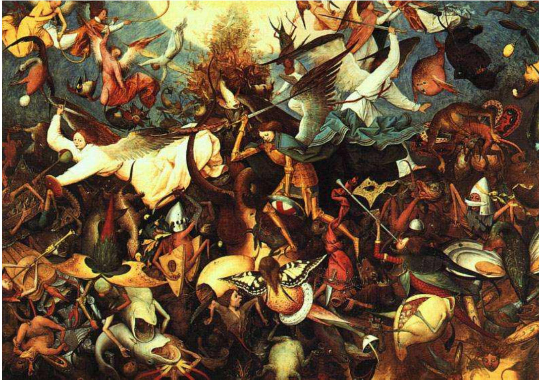
Pieter Bruegel de Oude, De val der opstandige engelen (1562), Museum voor Schone Kunsten, Brussel

Aan de val van Lucifer en de zondeval wijdde Joost van den Vondel (1587 –1679) de treurspelen Lucifer (1654), Adam in ballingschap (1664)