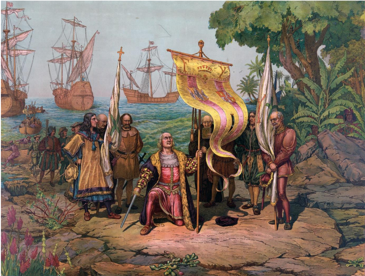
Amerikaans schilderij uit 1893.