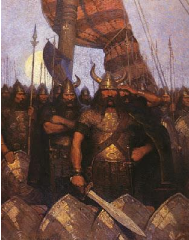
Illustratie van N.C. Wyeth in Scribner's Magazine, december 1910