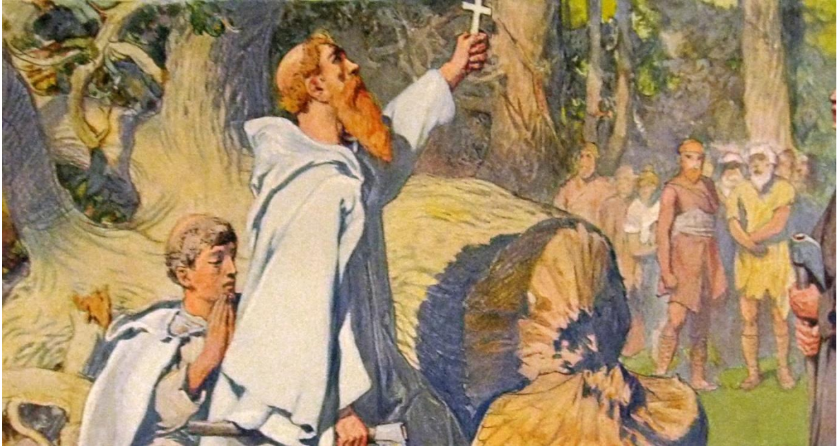
Bonifatius bij de heilige eik door Emil Doepler, ongeveer 1905