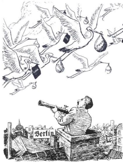
The BIRD WATCHER