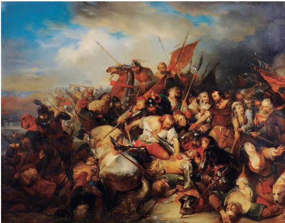
Afbeelding: De Slag der Gulden Sporen (1836) door Nicaise de Keyser. Het schilderij laat de overwinning zien en de moord op de aanvoerder van de Fransen. Dit schilderij zou Conscience geïnspireerd hebben tot het schrijven van zijn roman. (Publiek domein)

Bron: https://en.wikipedia.org/wiki/The_Lion_of_Flanders_(novel)#/media/File:384021-de_gulden_sporenslag(1)-26d5e6-original-1617352870_01.jpg