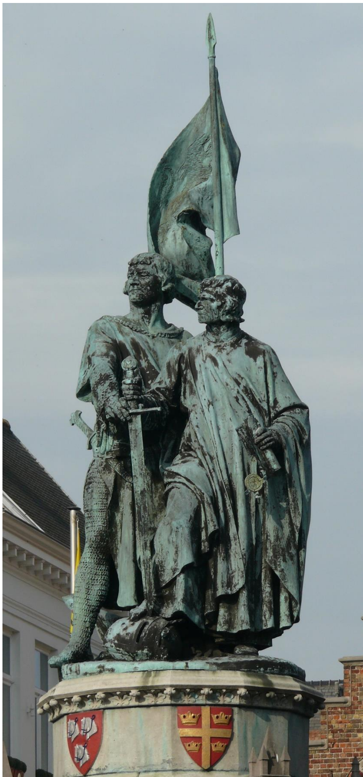
Afbeelding: Standbeeld van Jan Breydel en Pieter de Coninck op de Grote Markt van Brugge.