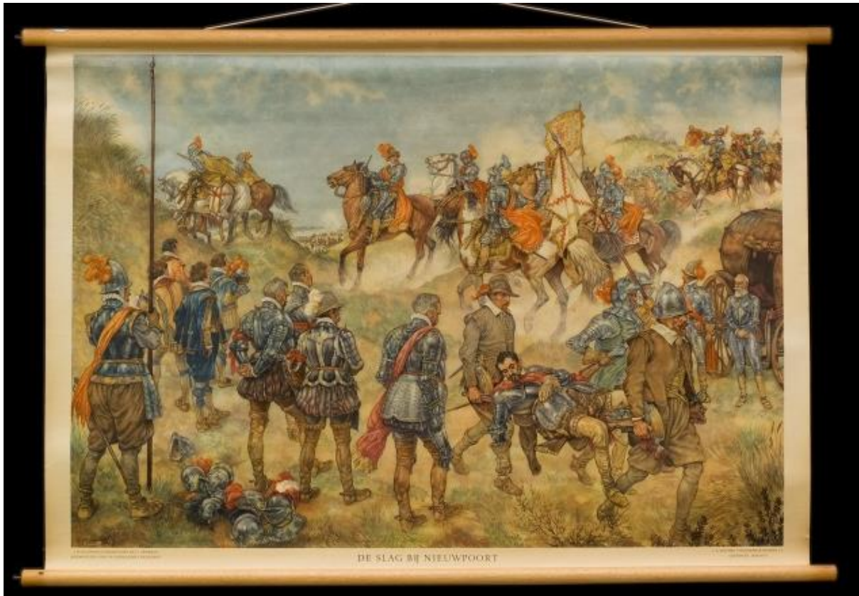
Legendarische schoolplaat van J.H. Isings over de slag bij Nieuwpoort uit het begin van de jaren vijftig (J.B. Wolters Groningen). 6