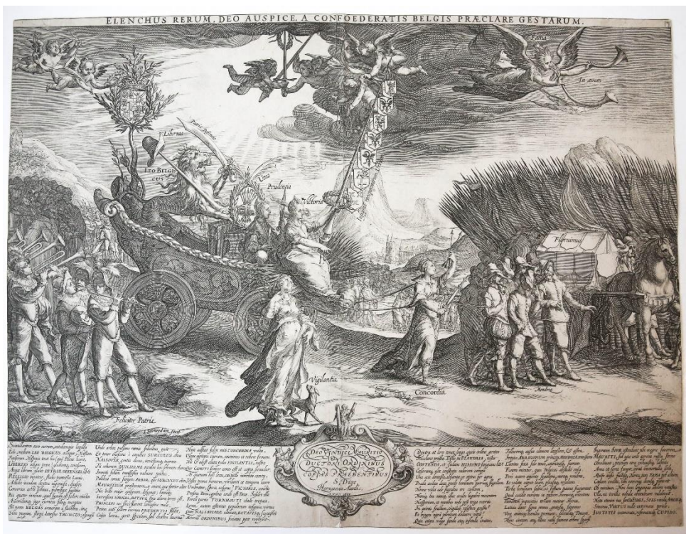
Allegorie op de overwinning bij Nieuwpoort van Jan Saenredam (1565-1607), gemaakt in 1600. Titel: 'Elenchus rerum, deo auspice, a confoederatis Belgis praeclare gestarum'. 8