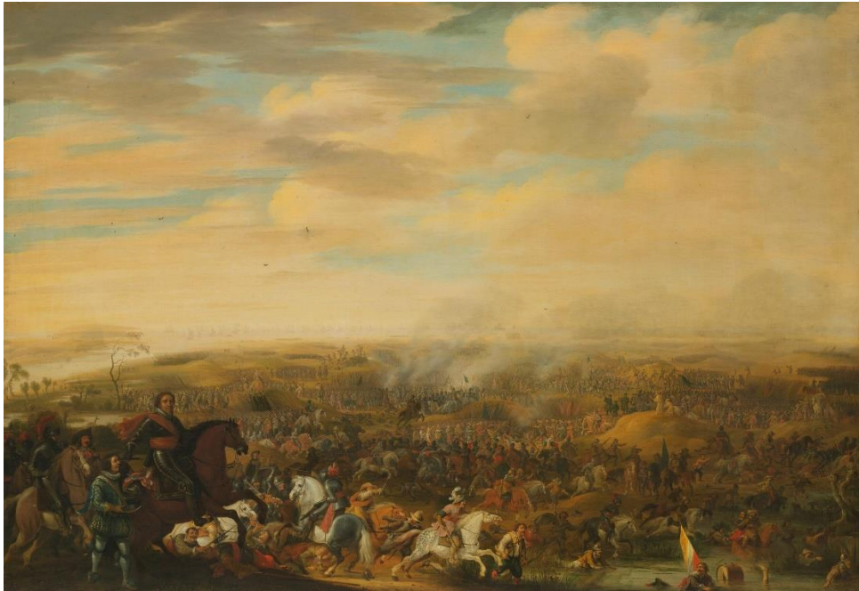
Slag bij Nieuwpoort door Pauwels van Hillegaert in de jaren dertig van de zeventiende eeuw geschilderd. 7