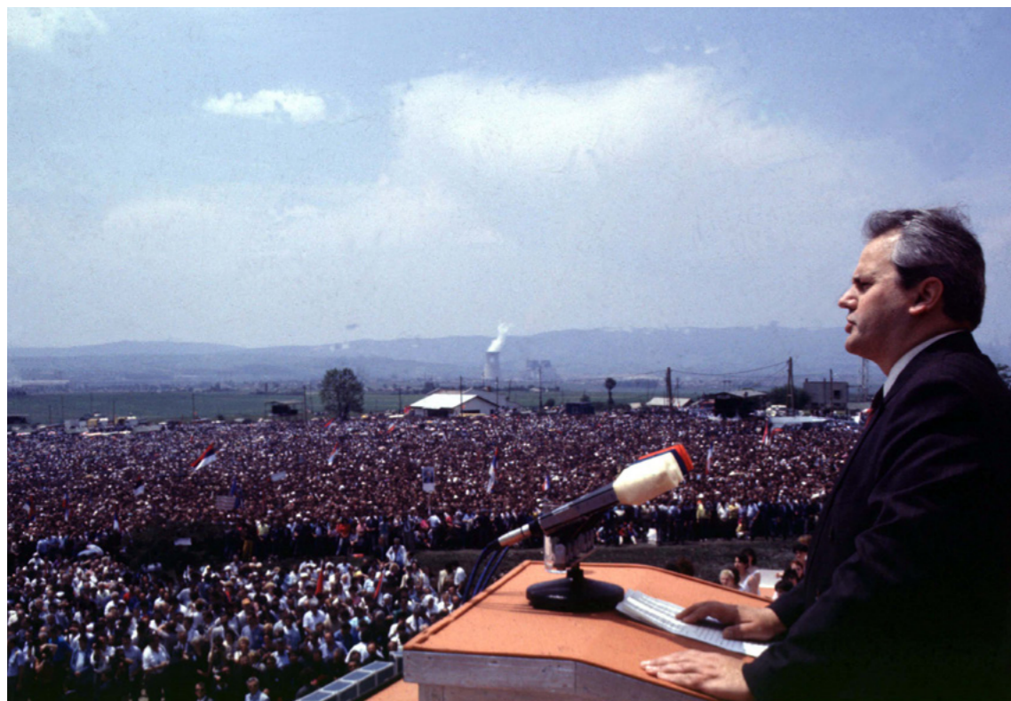
Afbeelding 4: Milošević op het Merelveld, in Kosovo, in 1989.

Het boegbeeld van het nationalisme onder de Serviërs werd Slobodan Milošević, de communistische partijleider in Belgrado. Hoewel hij aanvankelijk een tegenstander was van het Servisch nationalisme, werd hij na een bezoek aan Kosovo in 1987 geraakt door het vuur van de Servische natie: 'hij ging als een communist naar Kosovo Polje, en kwam terug als een Serviër'. 18 Met name de beslissing om de autonomie van Vojvodina en Kosovo grotendeels teniet te doen ten faveure van toenemende Servische invloed (1988) en de toespraak van Milošević op de herdenkingsbijeenkomst van de Slag op het Merelveld (1989) wakkerden de onrust en verdeeldheid in Joegoslavië verder aan. 19 Vooral Slovenië en Kroatië voelden zich bedreigd in hun autonomie door de toenemende macht van Servië (dat steun kreeg van Montenegro). 20