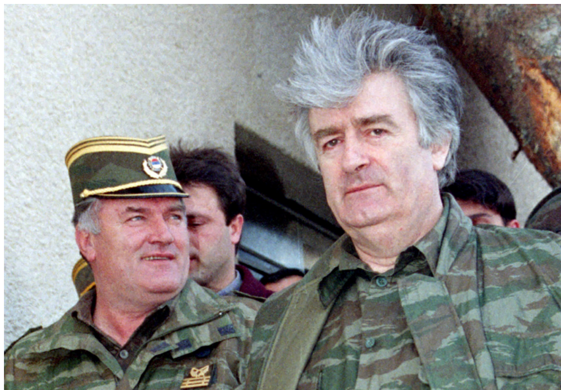
Afbeelding 5: Ratko Mladić en Radovan Karadžić, tijdens de oorlog.

Al vroeg tijdens de Bosnische Oorlog werd er heftig gevochten in de heuvels rondom Srebrenica. Het overwegend door Bosniakken bewoonde gebied van Centraal Podrinje (de regio rond Srebrenica) was van strategisch belang voor de Serviërs, omdat anders geen territoriale eenheid zou kunnen worden gerealiseerd ten behoeve van de nieuwe Servische politieke entiteit Republika Srpska . 27 Daarom werden de Bosniakken met geweld verdreven uit hun woongebieden in Oost-Bosnië, hun huizen en moskeeën verwoest en meer dan 3.100 burgers vermoord. Het Bosnische Instituut in Londen heeft een lijst gepubliceerd van 296 dorpen en dorpjes rond Srebrenica die door Servische troepen zijn verwoest tijdens de eerste drie maanden van oorlog (april - juni 1992). Meer dan drie jaar vóór de genocide van Srebrenica verdreven Bosnisch-Servische nationalistische - met steun van Servië en het Joegoslavische Volksleger (JNA) - ongeveer 70.000 Bosniërs uit hun huizen. 28