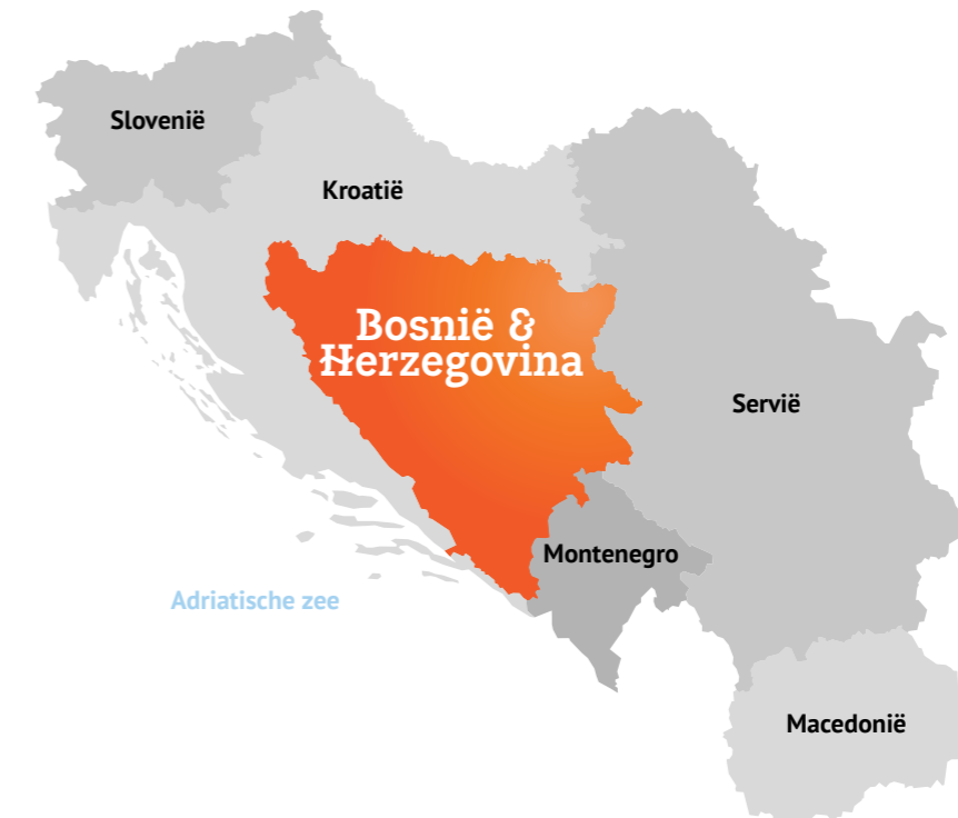
Afbeelding 2: Joegoslavië, vóór de oorlog

na afloop van dergelijke conflicten, hoewel een en ander soms wordt overschaduwd door een (actief) herinneringsbeleid dat het betwiste verleden vertroebelt of neutraliseert. 5