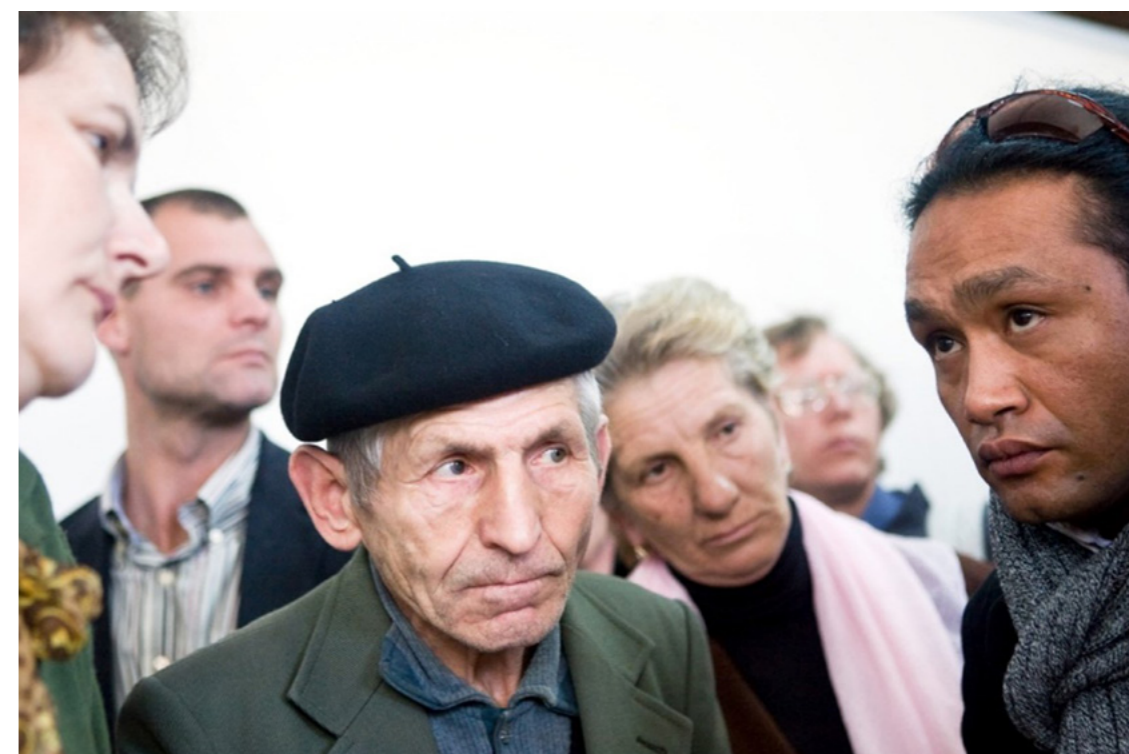
Afbeelding 1: PAX organiseerde meerdere gesprekken tussen Dutchbatters en overlevenden. Ontmoeting in 2007, in Srebrenica.

Hij komt in dit onderzoek naar de genocide van Srebrenica in het onderwijs tot belangrijke, zij het toch ook ontnuchterende conclusies. Er is zowel ruimte voor als ook noodzaak tot verbetering van wat het Nederlandse onderwijs biedt met betrekking tot deze periode uit onze gedeelde (Nederlandse, Bosnische, Europese...) geschiedenis. Srebrenica, in 1993 door de VN uitgeroepen tot safe area (veilig gebied), was zoals we weten uiteindelijk voor de mensen die voor hun veiligheid en overleven afhankelijk waren van de VN, niet veilig. In het onderwijs over Srebrenica echter kiezen