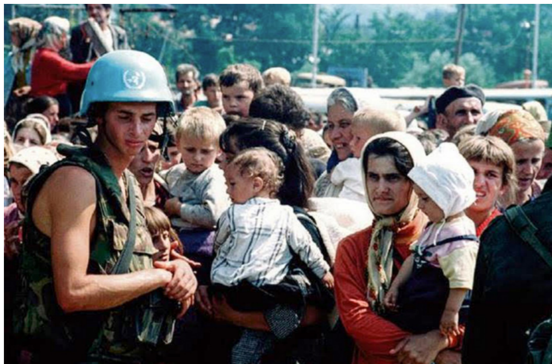
Afbeelding 14. 'Bosnische moslimvluchtelingen wachten op vervoer uit Srebrenica, nadat de stad door de Bosnische Serviërs is ingenomen (foto uit 1995)' 164

Zo is afbeelding 14 opgenomen in een paragraaf over 'Nederland en de wereldpolitiek', waarin wordt gesteld dat een Nederlands bataljon in Srebrenica vluchtelingen moest beschermen. 'De stad was omsingeld door vijandelijke troepen... De vijandelijke legers gingen tot de aanval over en ongeveer 8.000 vluchtelingen werden vermoord. De Nederlandse VN-militairen konden door hun te lichte bewapening en gebrek aan hulp geen weerstand bieden'. 164 Leerlingen zien vrouwen en kinderen, een enkele man en slechts één VN-militair, die niet als Nederlander herkenbaar is. Deze afbeelding verkleint de empathische afstand ten aanzien van het drama en kan daardoor het slachtofferschap van de vluchtelingen en tevens de onmacht van de VN-soldaten versterken.