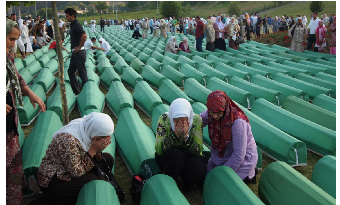
Afbeelding 9: Jaarlijks worden op 11 juli op een speciale begraafplaats in Potočari de stoffelijke overschotten begraven die in de twaalf maanden daarvoor geïdentificeerd zijn.

De (late) toekenning door de Nederlandse regering (in 2006) van een zogenaamd 'draaginsigne' aan de voormalige Dutchbat-militairen (uit 'erkenning voor hun gedrag in moeilijke omstandigheden') leverde echter weer veel kritiek op. Ook bij deze gelegenheid werd van rijkswege gewezen op het beperkte mandaat en de slecht uitgeruste aard van de missie. Overlevenden en familieleden van de slachtoffers veroordeelden de toekenning en noemden het een 'vernederende beslissing'. Protestbijeenkomsten vonden plaats in Den Haag, Assen (waar de ceremonie plaatsvond) en in Sarajevo. De Nederlandse ambassadeur werd door de Bosnische regering op het matje geroepen. 57 Ook buitenlandse kranten wijdden er kritische kolommen aan.