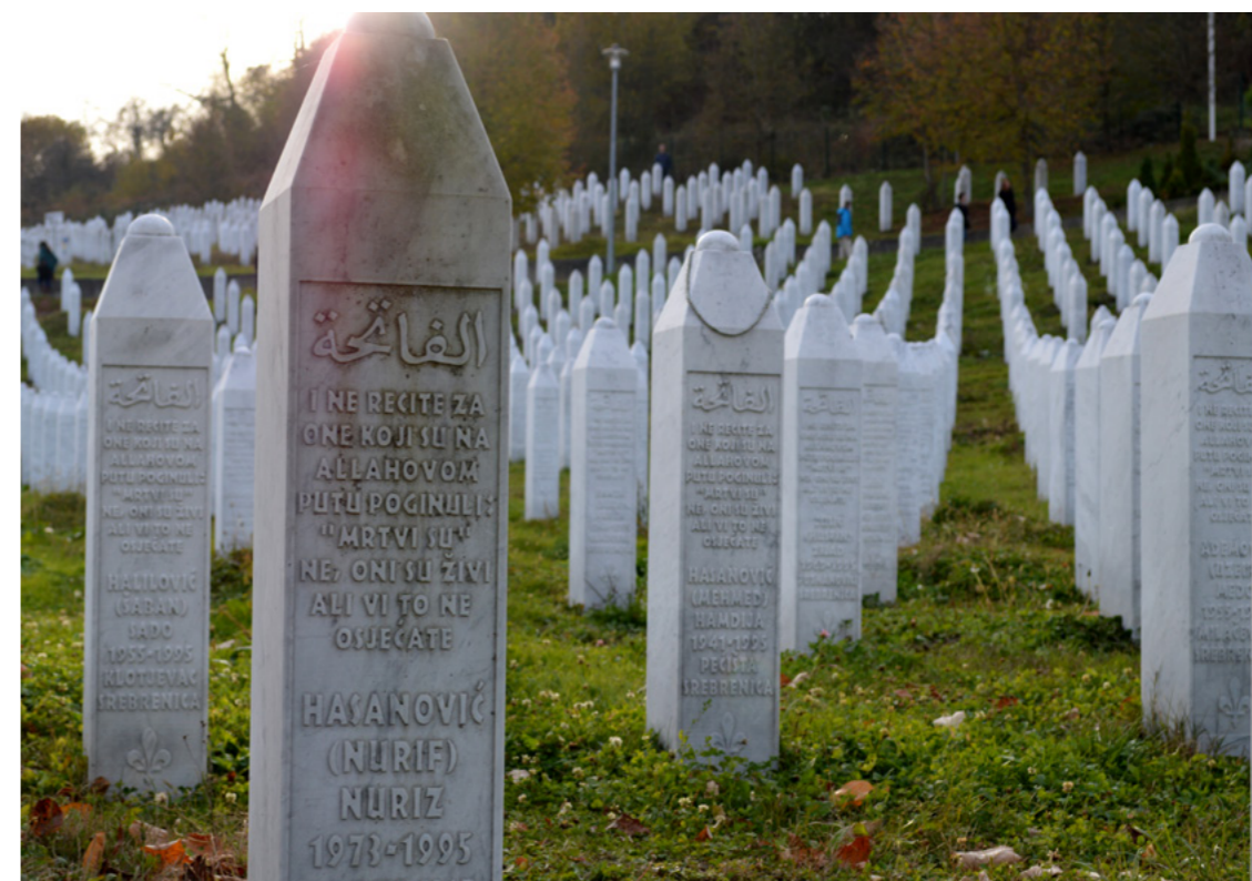
Afbeelding 15: De begraafplaats voor de slachtoffers van de genocide in Potočari. Er liggen inmiddels 6.643 slachtoffers begraven.

Het is van belang dat de verschillende perspectieven van de slachtoffers van de genocide een plaats krijgen in het Nederlandse geschiedenisonderwijs over Srebrenica, waarbij expliciet aandacht wordt besteed aan de complexe geschiedenis van deze regio, aan schending van grondrechten, aan de positie van overlevenden en nabestaanden en aan migratie als gevolg van oorlogsgeweld.