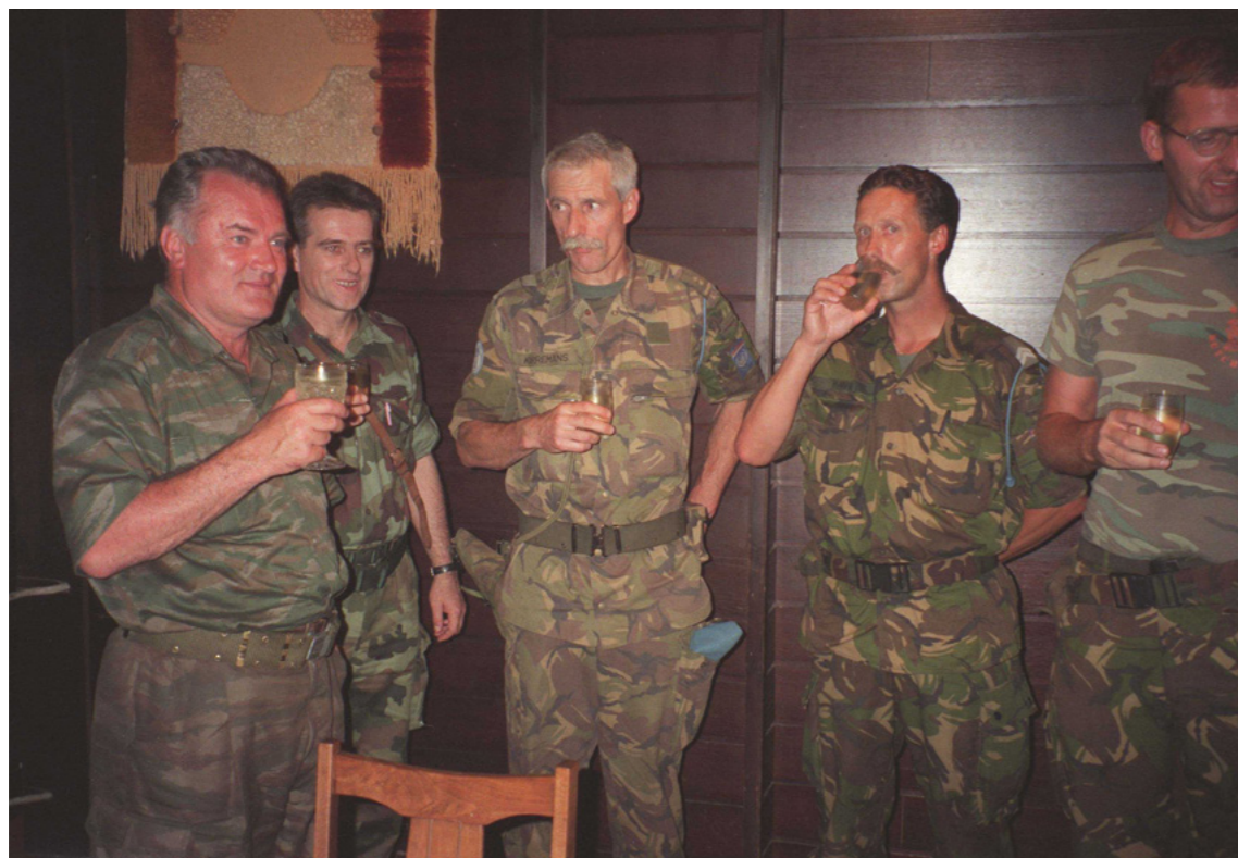
Afbeelding 7: Ontmoeting van Dutchbatcommandant Karremans met Bosnisch-Servische generaal Mladić, in Bratunac, 11 juli 1995.

middag van 13 juli waren alle Bosniakken die niet op de compound waren toegelaten afgevoerd. De militaire leiding van Dutchbat besloot daarop tot het wegsturen van de Bosniakken uit de relatief veilige compound. Ze werden door Dutchbat uitgeleverd aan de Bosnische Serviërs, waarop zij werden geseperreerd en afgevoerd. Alle mannen en jongens werden geëxecuteerd. In 2019 vonniste de Hoge Raad – voor een deel in navolging van het gerechtshof van Den Haag in 2017 - dat de Nederlandse Staat gedeeltelijk aansprakelijk was voor de gewelddadige dood van 350 moslimmannen die bescherming hadden gezocht in de VN-compound. Volgens het hof hadden Dutchbat-militairen 'onrechtmatig' gehandeld door mee te werken aan deze deportatie en had de leiding van Dutchbat geweten moeten hebben dat de 350 mannen "een reële kans hadden op een onmenselijke behandeling of executie". 40 Vrouwen en kinderen werden geëvacueerd naar veilige, door de Bosnische troepen gecontroleerde gebieden tientallen kilometers verwijderd van Srebrenica. Sommige Dutchbat-militairen waren getuigen van executies van Bosniak mannen door Servische militairen. Vrouwen en meisjes werden op weg naar voor hen veilig gebied veelvuldig lastig gevallen en tientallen werden uit de bussen gehaald en door Bosnische Serviërs verkracht en/of op andere wijzen seksueel misbruikt. 41