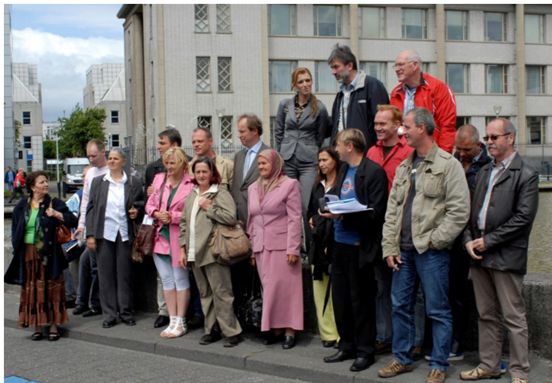
Afbeelding 11: PAX organiseerde in juni 2009 voor overlevenden en Dutchbatters een gezamenlijk bezoek aan het ICTY in Den Haag.

verantwoordelijk worden gehouden “voor de acties van hun soldaten tijdens vredesmissies”. 68 Ook vredesorganisatie PAX benoemde het baanbrekende juridische oordeel, en wees erop dat de eerdere stellingnames van Kok, Balkenende en andere politici met deze twee uitspraken van de Hoge Raad in feite onhoudbaar zijn geworden.