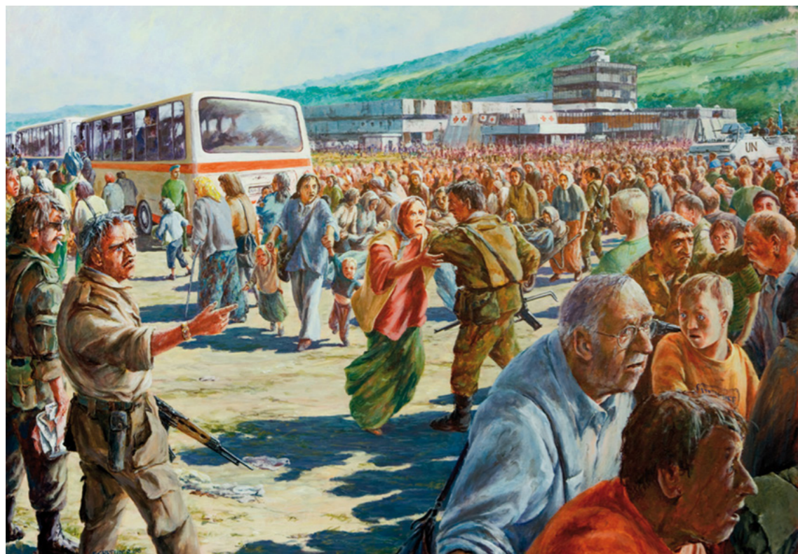
Afbeelding 13. Schoolplaat behorende bij het canonvenster over Srebrenica.

gediend, voorzeker - maar de commissie wil docenten en andere werkers met de canon uitdrukkelijk op hiermee verbonden risico's attenderen. 134