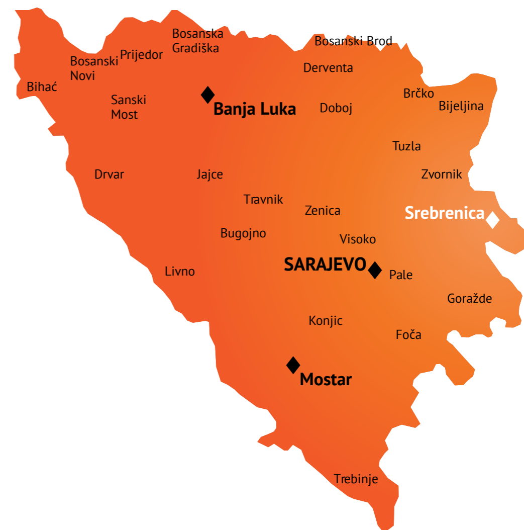
Afbeelding 3: kaart van Bosnië-Herzegovina, 1992