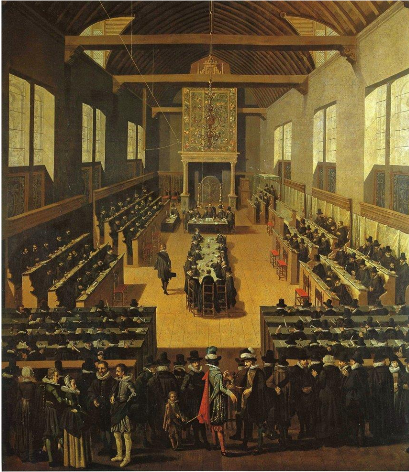
Synode van Dordrecht 1618-1619