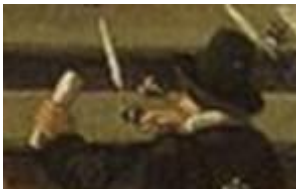
Cornelis Hillenius 32

Cornelis Hillenius stierf in Groningen op 13 januari 1632 'met een goed verstand en vast vertrouwen op zynen Zaligmaker'. 33