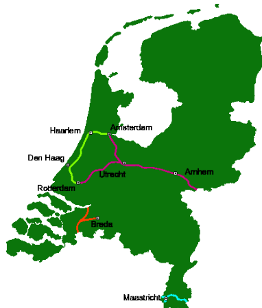
Spoorwegnet van Nederland in 1860

In 1823 maakte Jacob van Lennep een wandeltocht door het noorden van ons land. 1 Nederland , Nederland was toen net acht jaar een onafhankelijk koninkrijk, waarvan ook België nog deel uit maakte. Nederlands was een agrarisch land (de industriële revolutie kwam in ons land pas halverwege de eeuw langzaam op gang) en het zou nog lang duren voor er in het noorden van ons land zelfs maar een trein reed.