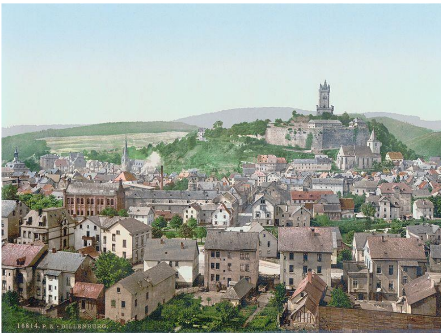
Dillenburg rond 1900.