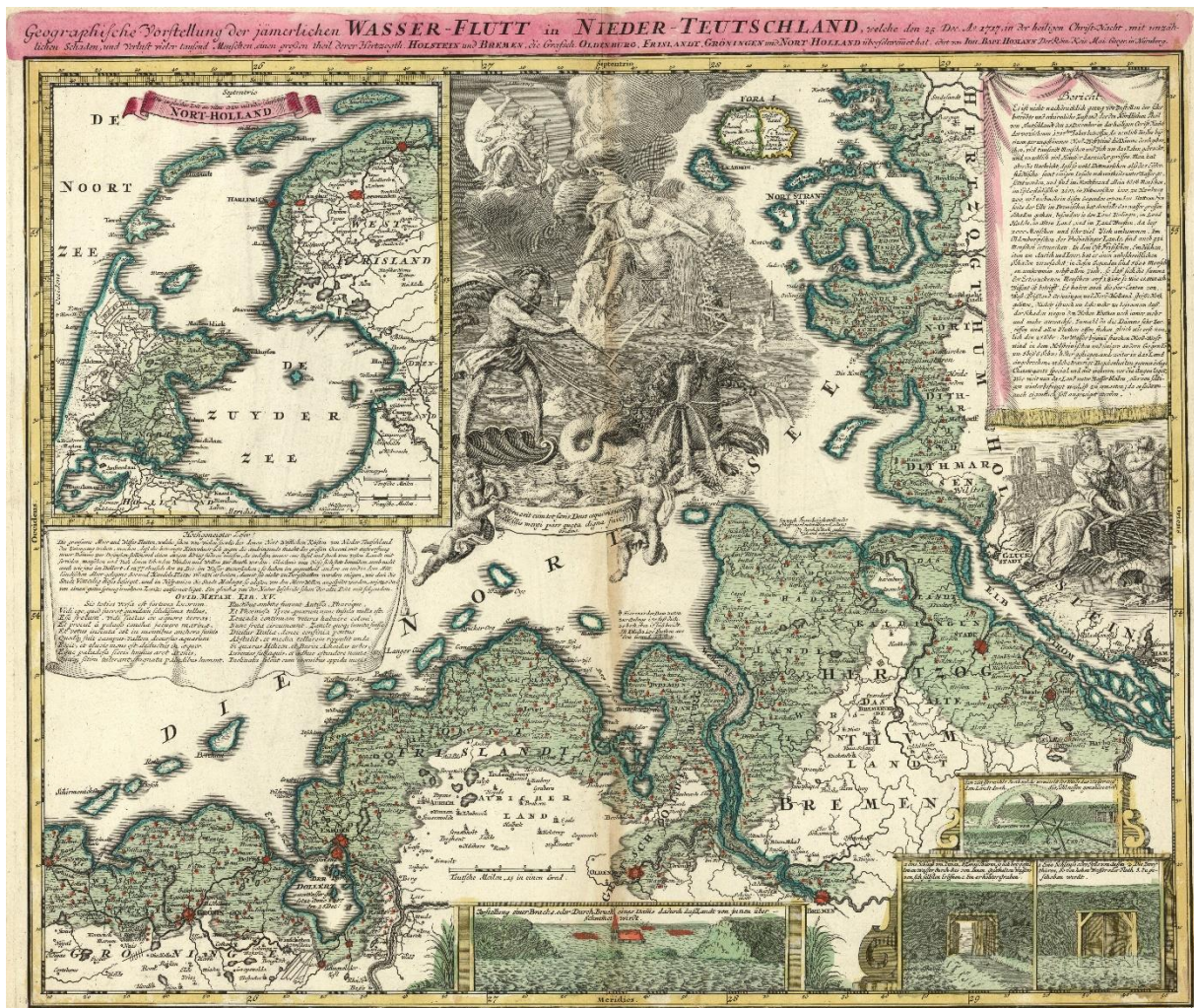
Kaart van Johann Baptist Homann uit 1720 van de Kerstvloed. 34