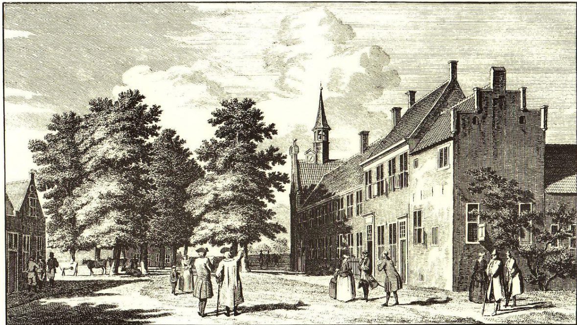
’T OUDE LANDSHUIS OF STAATEN KAMER TE ASSEN.

Een tweede klooster was dat van de Duitse orde in Bunne, het 'Duitse Huis der Heilige Maria te Bunne' (een dorp in de huidige gemeente Tynaarlo).