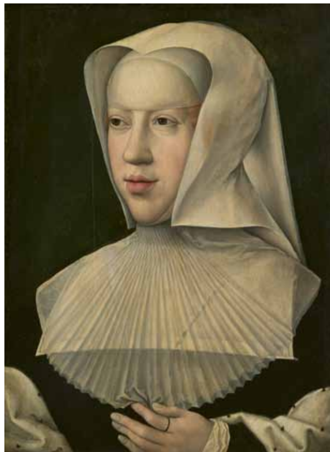
↑ Dit officiële portret van Margaretha van Oostenrijk als weduwe werd geschilderd door haar hofschilder Barend van Orley ca. 1518, maar werd nadien vele malen gekopieerd. Margaretha was toen 38 jaar oud en wilde met dit schilderij beklemtonen dat ze geen candidate meer was voor een huwelijk.

De volgende jaren waren in rouw gehuld. De pater familias van de Habsburgers, Maximiliaan van Oostenrijk, besliste dat zijn dochter Margaretha zowel de voogdij over de kinderen als de landvoogdij over de Nederlanden zou waarnemen. Margaretha van Oostenrijk was 26 jaar toen haar broer, Filips de Schone, in Spanje het leven verloor. Ze was zelf ook niet door het noodlot gespaard. Ze had al drie huwelijken achter de rug. Een eerste keer met de Franse kroonprins, die haar had gedumpt toen ze elf jaar oud was, daarna met de Spaanse kroonprins, maar die was binnen het jaar na hun huwelijk overleden, ten slotte met de uitbundige en knappe hertog van Savoye, die op zijn beurt overleed na drie jaar huwelijk. Margaretha was daardoor zo aangeslagen, dat ze nu uitdrukkelijk koos voor de weduwstaat. Vlak voor Pasen 1507 kwam ze in Mechelen aan, waar ze de rest van haar leven zou blijven wonen. Ze begon er meteen met de bouw van een nieuw paleis, vlak