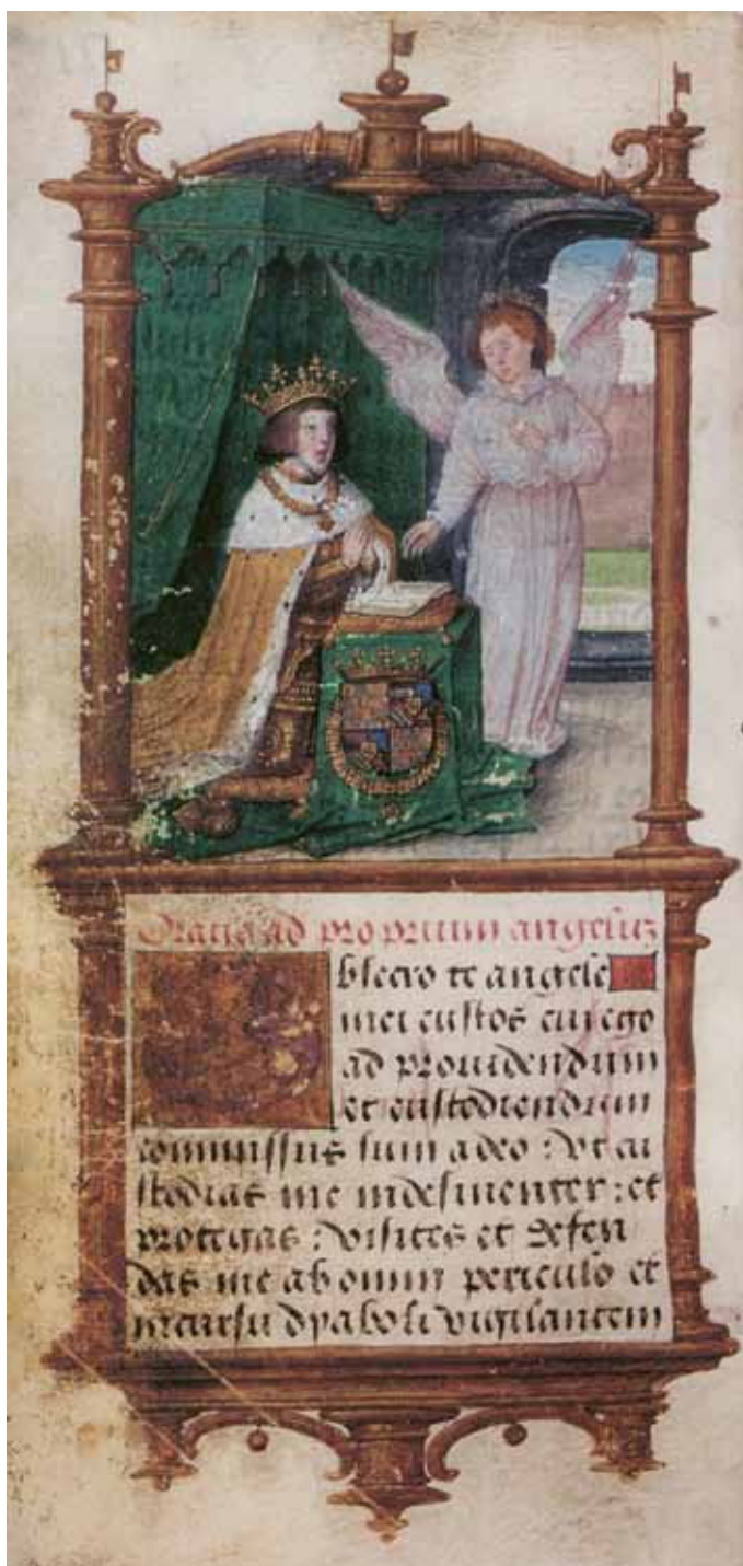
↑ Karel, koning van Spanje, bidt tot zijn bewaarengel, ca.1516, in Oud Getijdenboek van Karel v. Het boek werd aan de zestienjarige Karel geschonken door zijn tante, Margaretha van Oostenrijk. Op deze miniatuur zien we Karel met een hermelijnen mantel, de ordeketen van het Gulden Vlies en de (Spaanse) koningskroon.

dezelfde Adrianus echter weinig kritiek op de wantoestanden in de kerk, al was hij zich daarvan terdege bewust. Hij werd later een van de eerste pausen die geprobeerd heeft de kerk diepgaand te hervormen.