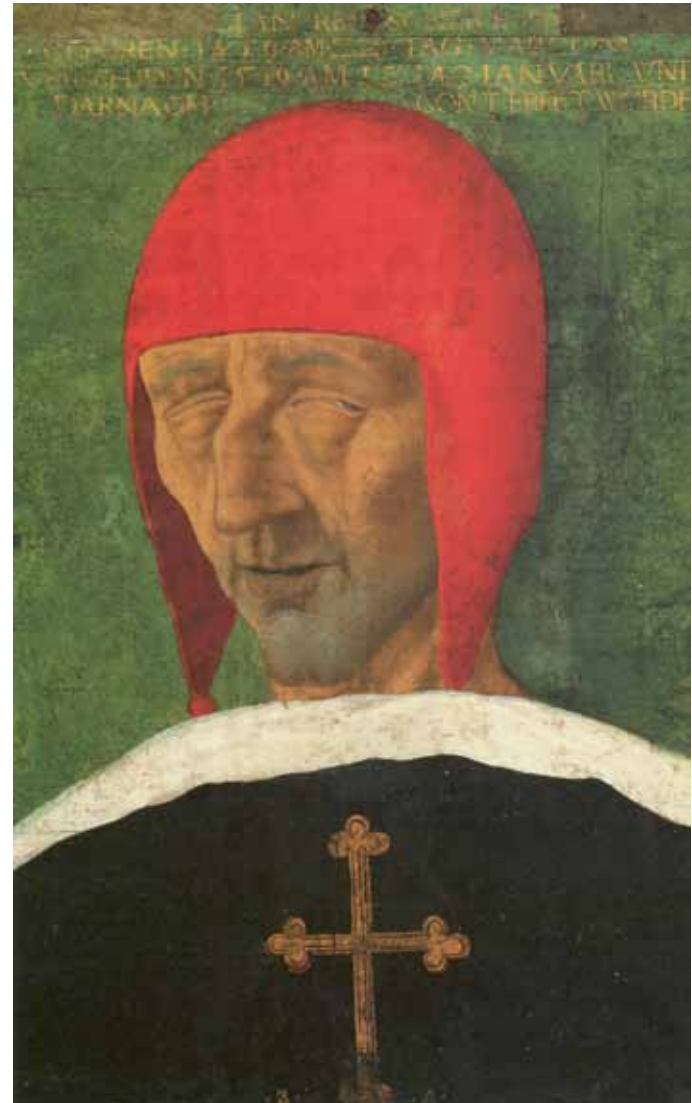
↑ Afbeelding van de dode Maximiliaan I († 1519) door een onbekende schilder met initialen A.A., waarvan heel wat kopieën werden gemaakt. Maximiliaan overleed op 12 januari 1519 in de burcht van Wels, toen hij onderweg was van Innsbruck naar Linz. Hij leed al een tijdje aan darmkanker. Hij zou nog zelf zijn lijkkleed aantrekken en beval dat men hem na zijn dood zou geselen, zijn haar afscheren en alle tanden zou trekken, om hem vervolgens zonder balseming in een lijkkak te naaien. Zijn deemoedigheid wekte grote bewondering, reden waarom er van hem een ontluisterend portret werd gemaakt.