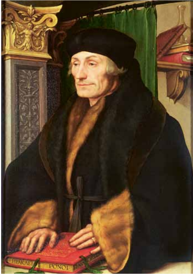
↑ Portret van Desiderius Erasmus door Hans Holbein de jongere. De schilder maakte in 1523 drie portretten van Erasmus, waarvan dit het grootste en mooiste exemplaar is. Op de snede van het boek lezen we de Griekse tekst: 'Herakleioi Ponoï Erasmi Roterodami' (De Herculische werken van Erasmus van Rotterdam). Dat was niet helemaal ernstig bedoeld, getuige de licht spottende glimlach van de auteur. Erasmus schonk dit portret in 1524 aan zijn beschermer William Warham, aartsbisschop van Canterbury.

prins op grond van vaste principes en ideeën absolute voorrang moet krijgen, zodat hij zijn kennis kan opdoen uit de theorie en niet uit ervaring. De lange ervaring, die de jeugd ontbreekt, zal hem verstrekt worden door advies van oudere mannen.