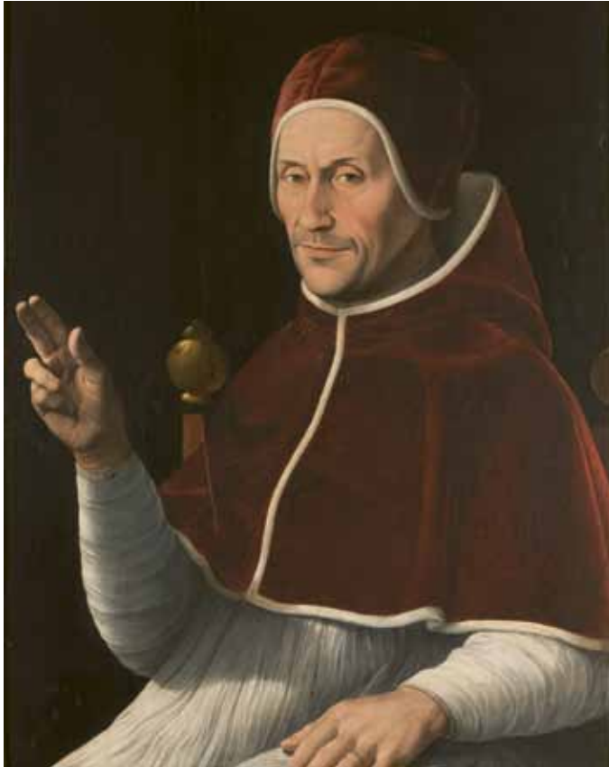
↑ Portret van Adrianus Florenszoon naar een verloren origineel dat Jan van Scorel in 1523 in Rome schilderde. Hij beklemtoonde de spreekwoordelijke soberheid van de nieuwe paus, die overigens nog hetzelfde jaar zou overlijden.

een spirituele beweging die omstreeks 1380 in de IJsselstad Deventer was ontstaan en nadien uitwaaierde over heel de Nederlanden en westelijk Duitsland.