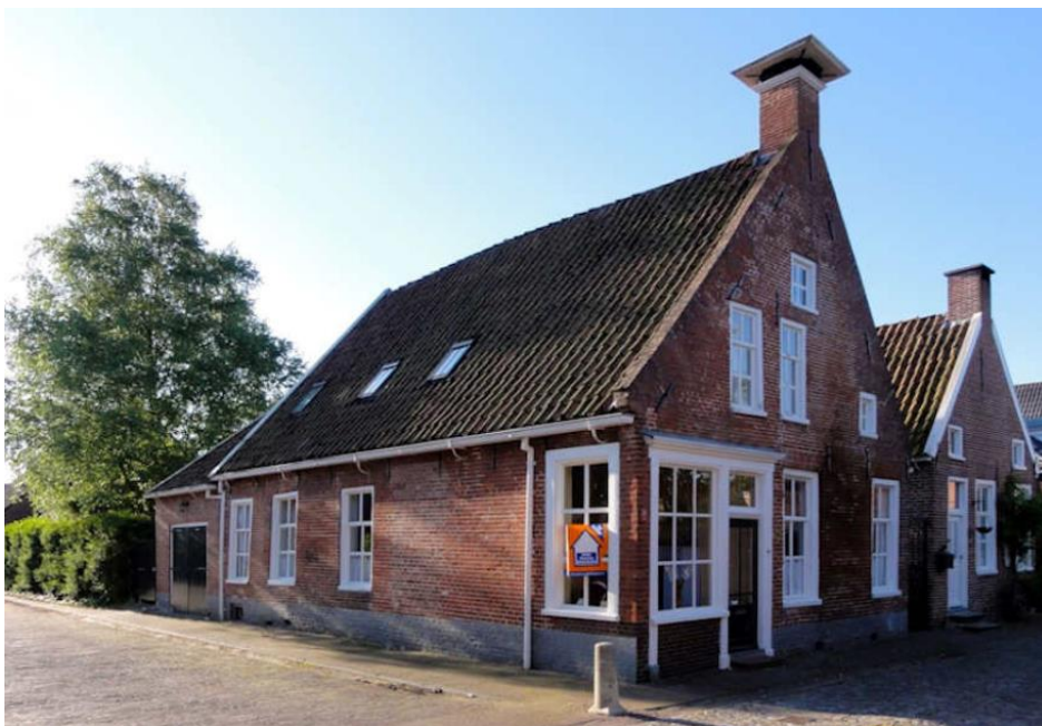
Achterstraat 26, een pand uit 1648.