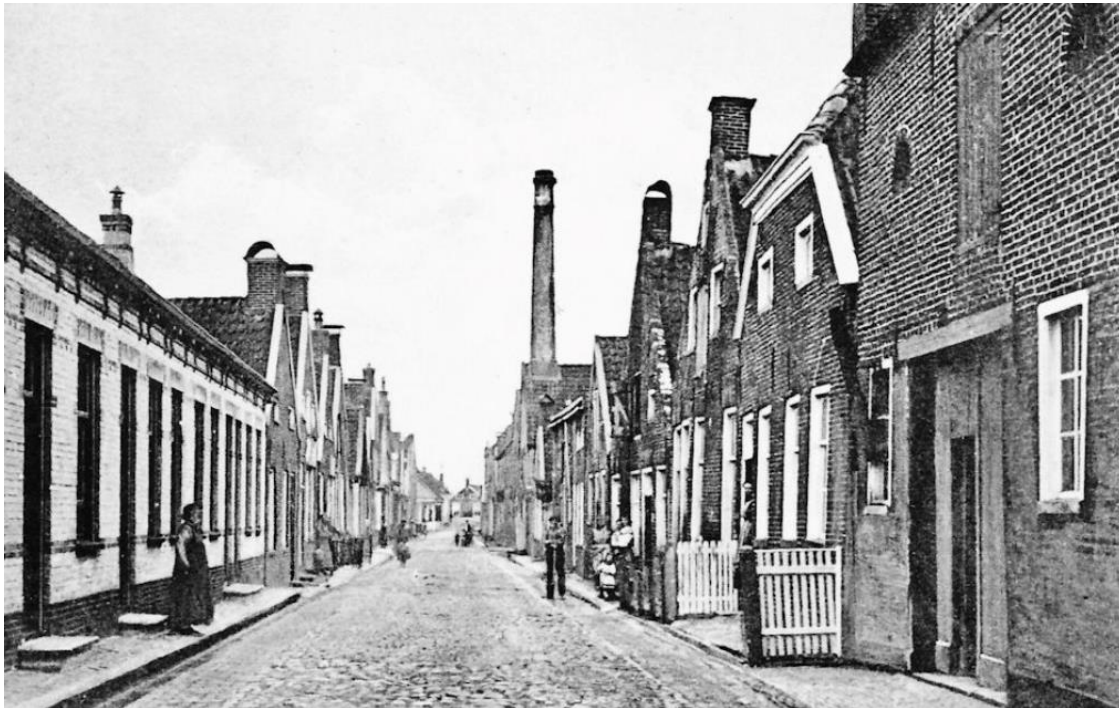
De Achterstraat in Nieuweschans in 1910.

kunnen erven. Alle kinderen delen desondanks gelijk in wat er over is. De armen van Nieuweschans krijgen een ducaton of 3 Caroliegulden en 3 stuivers. 1