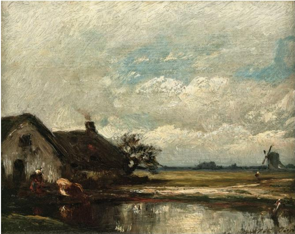
Jules Dupré, twee hutten.

In het daar gemaakte schilderij heeft Van Gogh, net als zijn veelvuldig geroemde voorbeeld, niet veel oog voor detail. Dit in tegenstelling tot het getekende en in waterverf uitgevoerde werk. Hierin komen belangrijke details naar voren: de indeling van de vensters, de planken in de voorgevel, de dakbedekking. Er is wat dat betreft sprake van een groot verschil tussen het geschilderde en het getekende en in waterverf uitgevoerde werk. Dit verschil kan natuurlijk deels ontstaan zijn doordat Vincent het werken in olieverf in 1883 nog onvoldoende beheerst, terwijl hij zijn tekentalent in Etten en Den Haag al veel sterker ontwikkeld heeft.