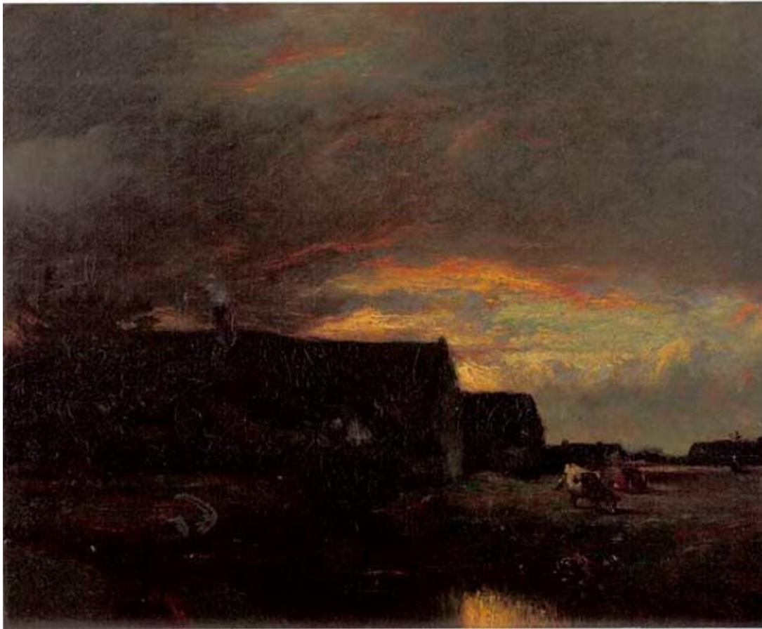
Jules Dupré, avond