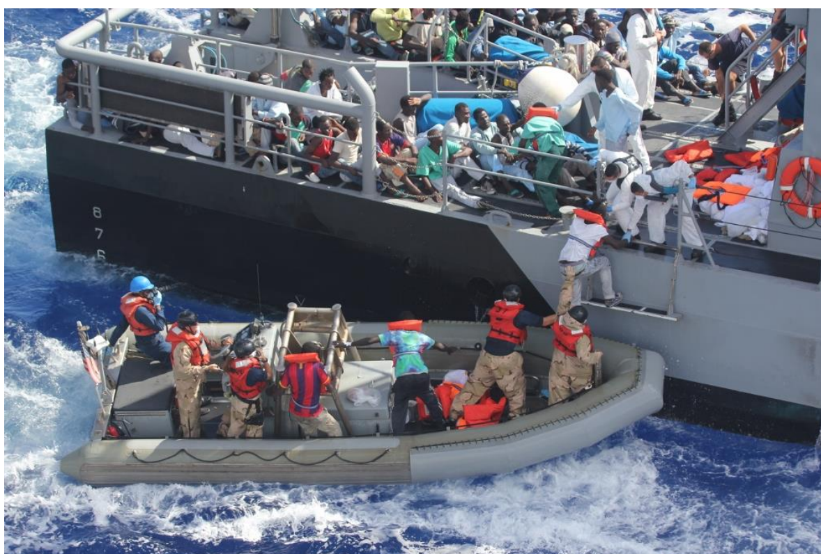
Afbeelding: Een groep bootvluchtelingen wordt gered bij Malta in oktober 2013. (Publiek domein)