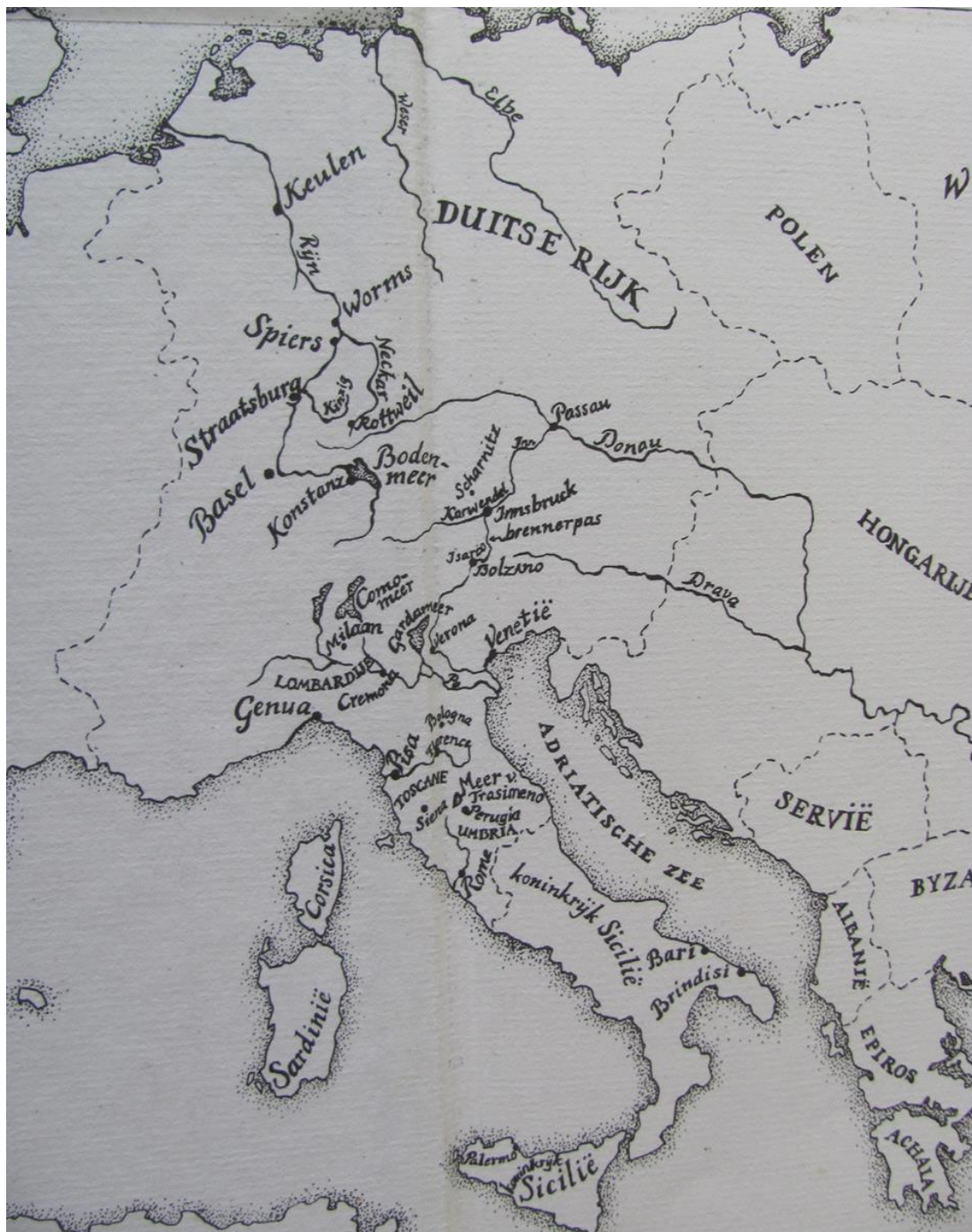
Afbeelding: Fragment van de kaart op de binnenkant van de kaft.