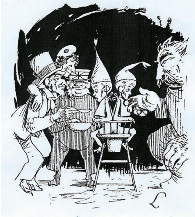
De Duitse Siamese tweeling (Duitse spotprent)